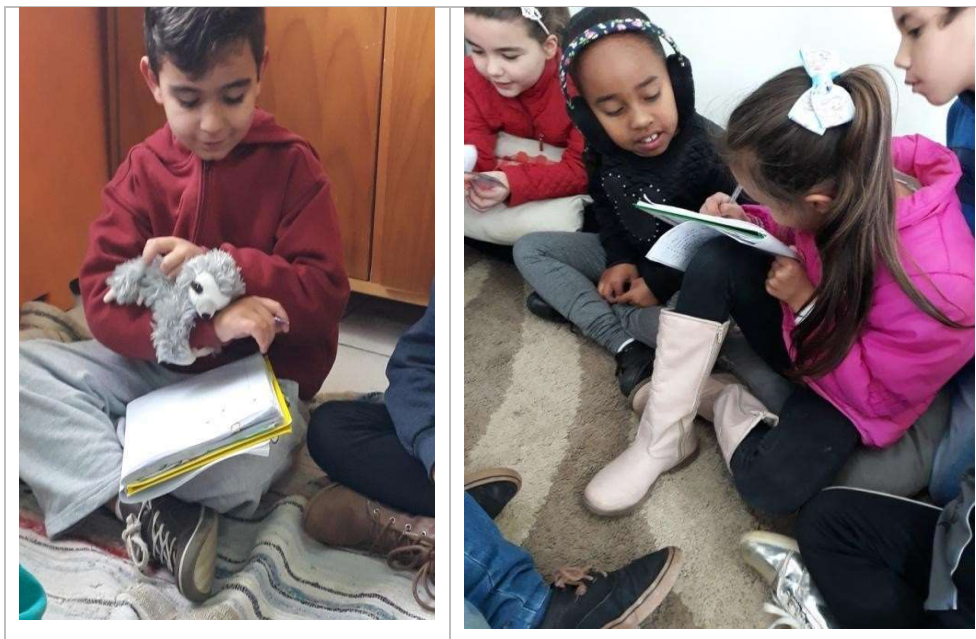
Figura 11 – Diário de Bordo com elemento de fala na acolhida por 15min no início

Conseguimos chegar a este exercício com sete meses atuando com aulas duas vezes por semana, mediando conflitos e criando uma comunicação não violenta. Até chegar a esta harmonia, um longo percurso de aprendizados mútuos foi sendo feito a cada dia, com avanços e demandas a serem revisitadas com frequência. Os acertos aconteciam no caminhar, experimentando as melhores oportunidades.