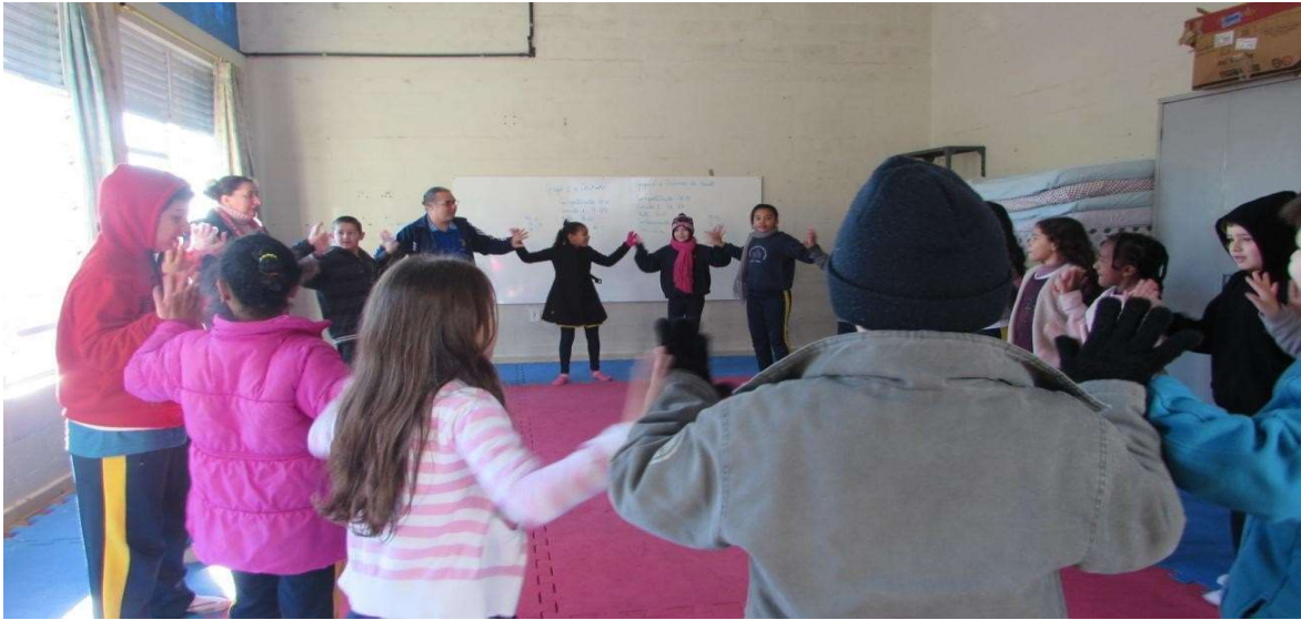
Figura 10 – Roda de comunicação afetiva e eutonia de mãos – Biodanza para crianças