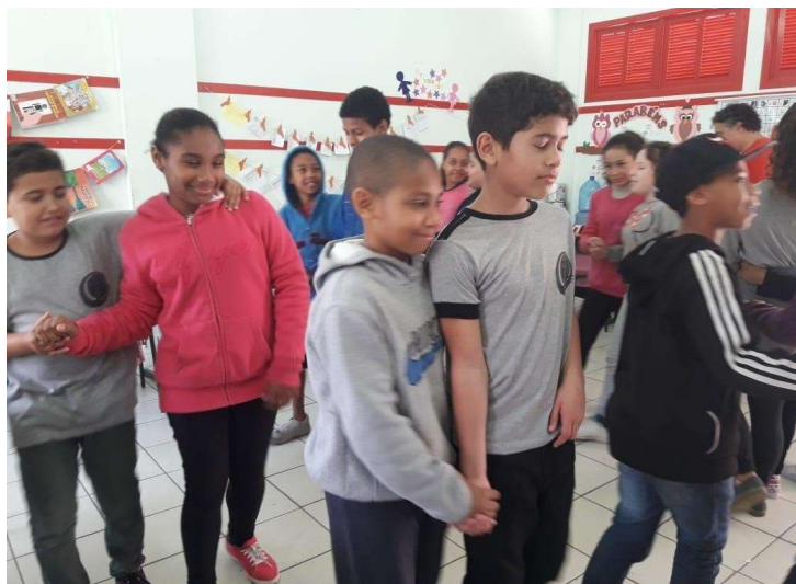
Figura 4 – Caminhar confiando 7

A confiança entre as crianças vai sendo tecida de maneira progressiva. Constroem relações respeitadas no percurso do desenvolvimento da inteligência afetiva, por meio da qual acontece o aprofundamento das atitudes sinceras, com gestos de reciprocidade entre os pares. Leva um tempo para que a turma alcance este estado harmônico, para que os acordos do bem viver estejam presentes nas aulas, para se aprimorar o diálogo corporal, sem violências e respeitando as diferenças.