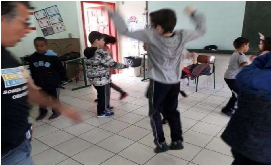
Figura 14 – Expressão no centro da roda