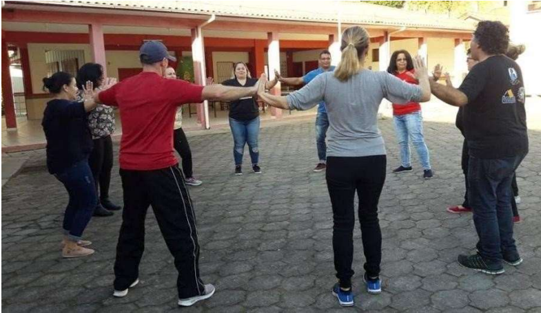
Figura 9 – Formação Continuada de Educação Biocêntrica com a Equipe Multiprofissional da E.E.B. Fábio Silva em Tubarão (SC)