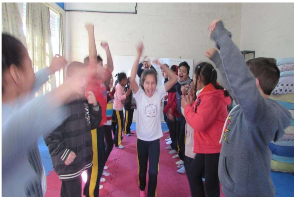
Figura 5 – Túnel da vitória

Estes tempos afastados das vivências promoviam uma regressão nos acordos didáticos. Observamos que é na periodicidade e na intencionalidade pedagógica e afetiva que a transformação social ocorre. Como a aula é dividida em três tempos, no primeiro momento de acolhida formamos a roda de sentimentos e memórias da aula anterior, para oportunizar o direito de fala e escuta atenta com o auxílio de um objeto: o bastão falador. É ali que se faz o registro no diário de bordo. Neste tempo de 15 minutos, cada uma fala brevemente como está e o que se lembra da aula anterior. No segundo momento, trabalhamos a corporeidade e a integração de grupo; por último, realizamos uma reflexão acerca do aprendizado e um exercício de relaxamento.