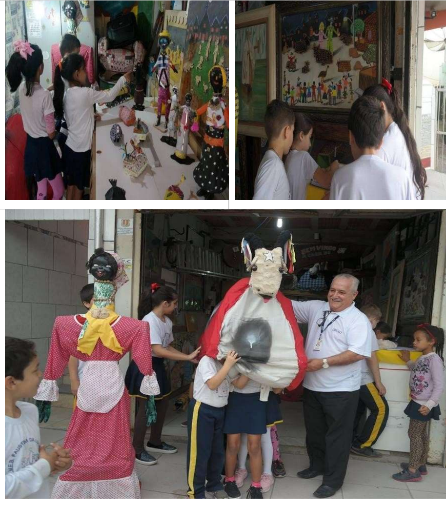
Figura 12 – Saída de campo 10

memórias da aula anterior. Ficavam atentos aos materiais utilizados, e o mais popular era o bicho preguiça, que prende no braço (Figura 11). O bicho de pelúcia é aguardado ansiosamente, mas cada um tem seu tempo para desfrutar de sua companhia.