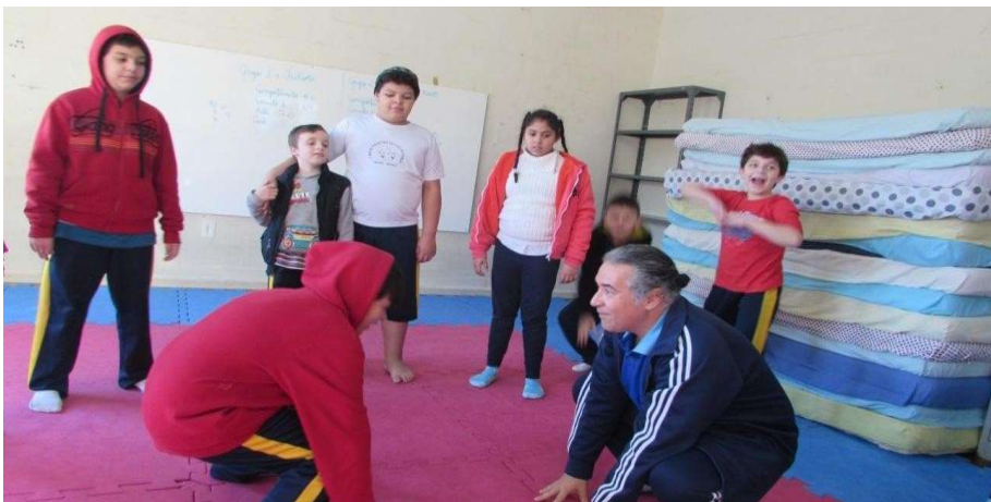
Figura 8 – Demonstração do exercício do espelho