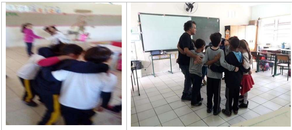
Figura 15 – Caminhando juntos e abraçados e Roda de Embalo – Biodanza®