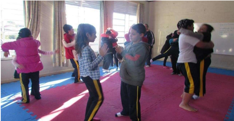
Figura 7 – Sincronizações e abraços