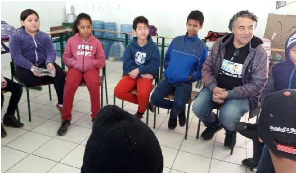
Figura 13 – Roda de sentimentos e escuta atenta