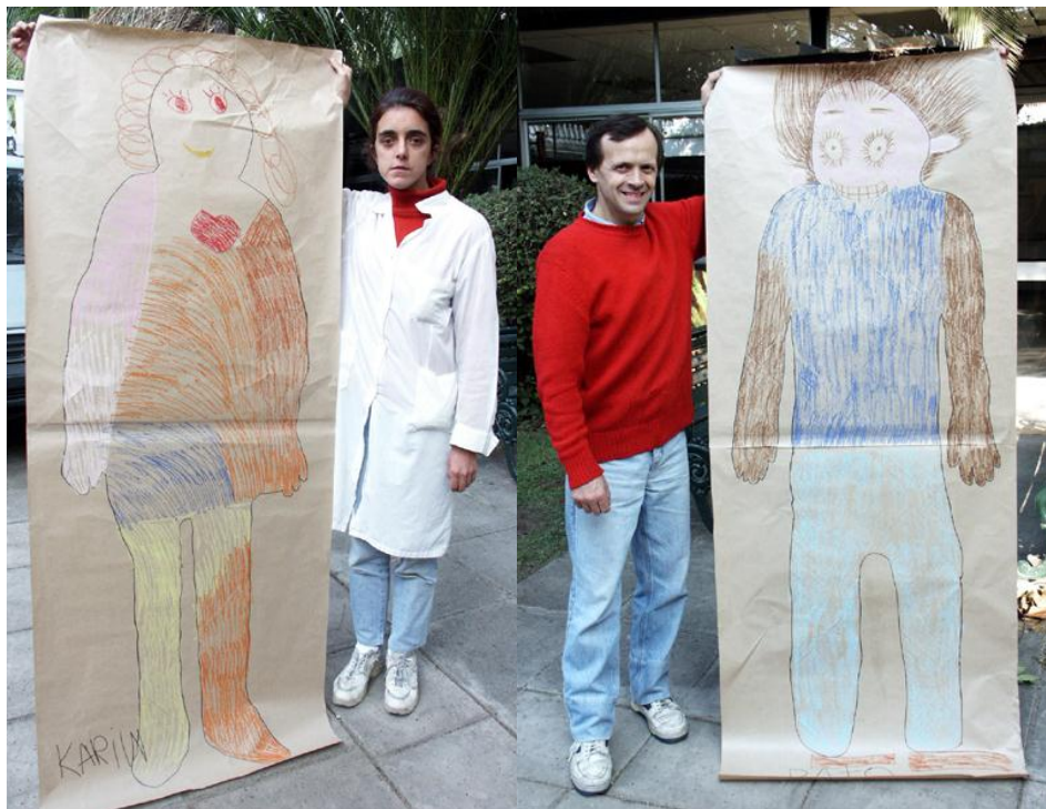
Pintura del cuerpo con lápices pastel cera sobre papel kraft