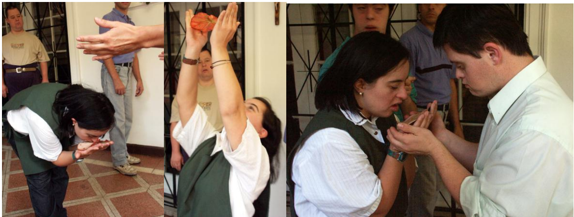
Dar y recibir la flor (con hojas de otoño)