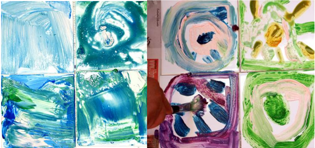
Pintura de acrílico sobre azulejos