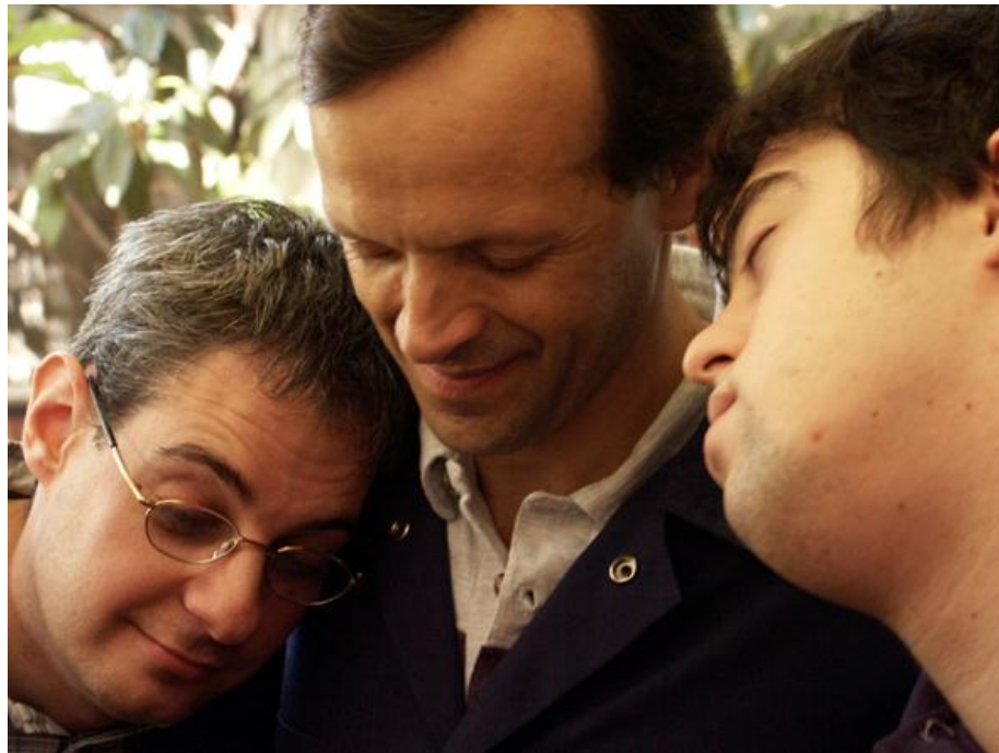
Ronda de Mecimiento