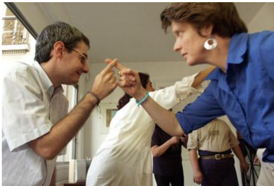
Danza de Eutonía