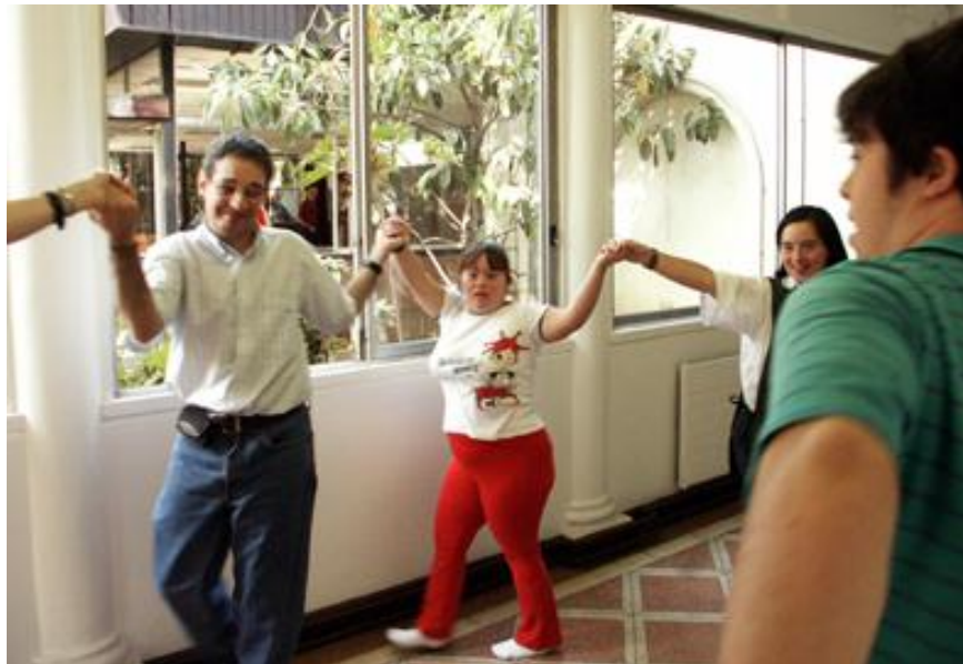
Rondas de Inicio