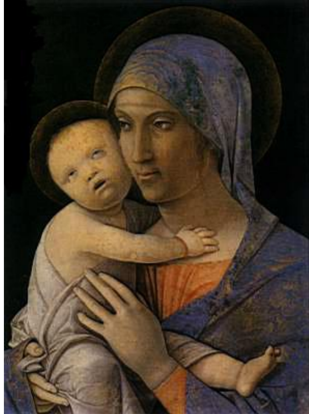
Virgen con Niños en los Brazos, de Andrea Mantegna