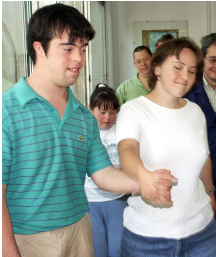
Caminar a Dos