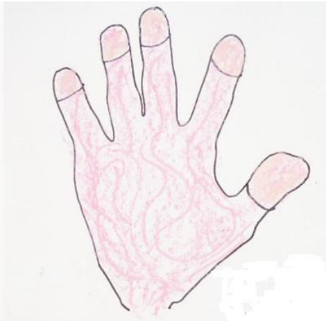
Pintura de la mano con lápices pastel graso sobre cartulina blanca