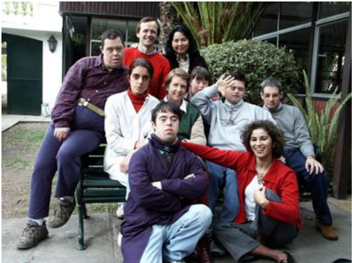
El Grupo de Práctica