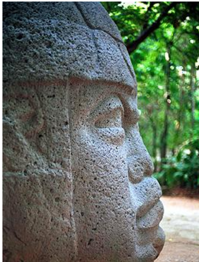
Cabeza Colosal Olmeca