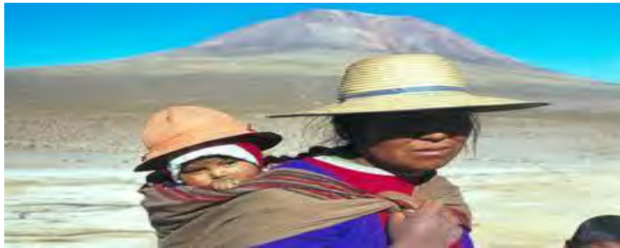
Apego y afectividad en los primeros meses de vida

Se hace para mí muy necesario recalcar este punto, ya que pienso que es un asunto de gran relevancia y no menos importante estimular el apego con las wawas aymaras y con los bebés en sus primeros 6 meses de vida. Las mujeres de la comuna han optado siempre por la lactancia materna natural, lo que es aconsejable y valioso. Pero falta aún estimular las sensaciones positivas con el bebé desde el útero, como técnica de prevención de instintos auto y hetero destructivos.