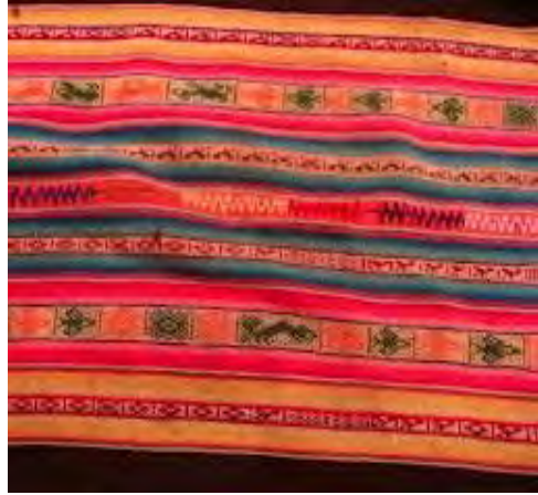
Típico telar andino

La comida también es riquísima y autóctona, conservando lo natural mezclan los sabores de variadas formas. Además del baile, el arte se expresa en los jóvenes que tocan lakitas, un instrumento musical andino, y en las bandas de bronces para las ceremonias. Los niños juegan en la calle o chacras desplegando su creatividad en los juegos.