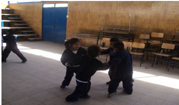
Niños en Biodanza (Camiña)

Sin embargo, los adultos son más fríos afectivamente, que piensan solo en el trabajo, carecen de tiempo para compartir y disfrutar con los otros. La mirada del hombre y la mujer aymara es penetrante, casi desafiante, supongo que por la historia que les ha tocado vivir y porque la han aprendido como una forma de defenderse. Cuando alguien de afuera llega a Camiña, todos saben que no pertenece a la comunidad y hay que ganarse la confianza de las personas con el tiempo para sentir aceptación. Las madres y padres no abrazan ni besan muchos a los niños, pues saben que algún día se van a ir y seguir su camino. Hombre y mujeres tienen prohibido demostrar su amor en público, ya que besarse o darse la mano es algo "íntimo y privado". A mi parecer esto reprime la afectividad.