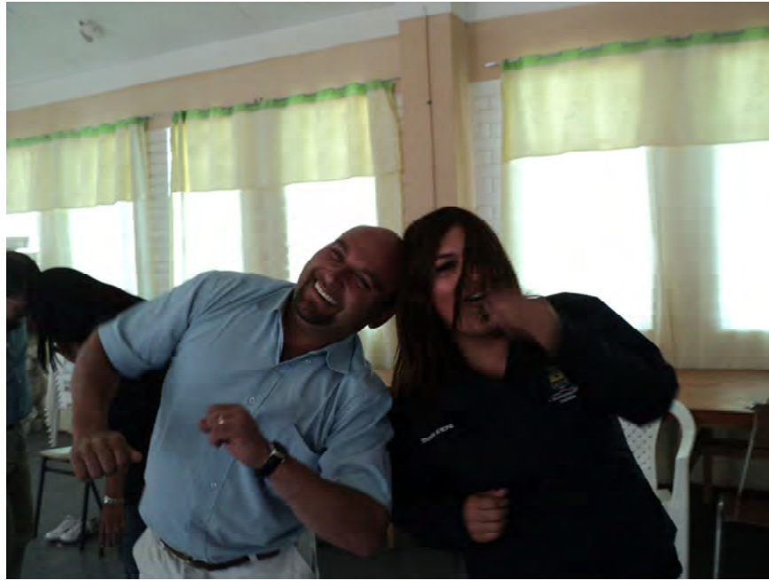
Estimulación de la creatividad a través de la Biodanza