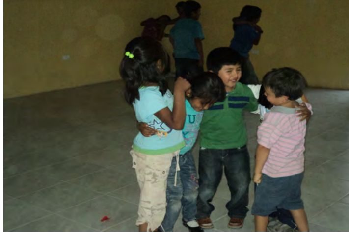
Niños en lo cotidiano (Camiña)