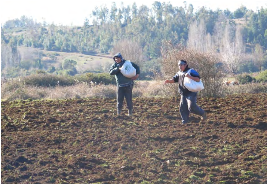
Vitalidad: conexión con la tierra

A través de ejercicios de Biodanza podemos lograr que se manifieste el inconsciente vital, generando vivencias, estados de humor, sensaciones corporales, instintos en el que no participe el intelecto. Se puede llegar a repetir en la cotidianeidad y conscientemente lo que muchos habitantes de Camiña hacen cuando hay celebraciones y bailan vitalmente, saltando, conectándose, vibrando con la música, con su cuerpo, con la naturaleza y con todo lo que los rodea.