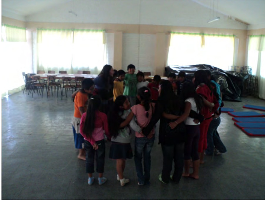
Biodanza con niños