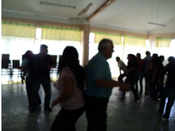
Estimulación de la sexualidad a través de la Biodanza en Camiña.

A través de la Biodanza se pretende abandonar los patrones culturales represores para restablecer el equilibrio en el organismo, considerando que somos seres cognitivos, espirituales y sexuales con necesidad de amar y ser amados.