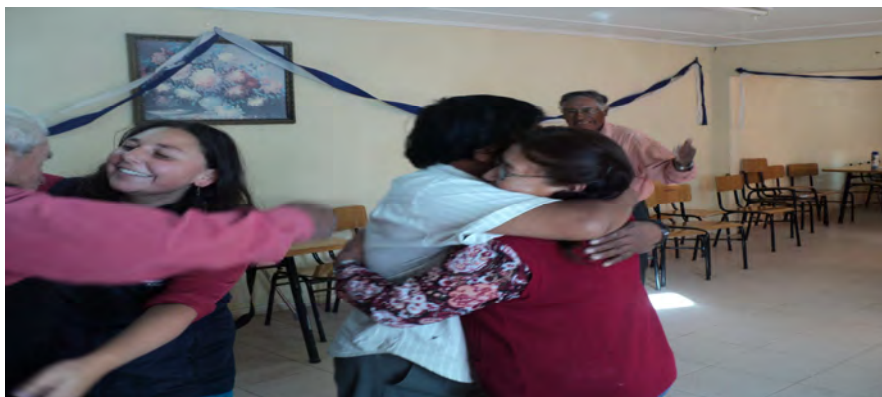
Afectividad en los adultos mayores a través de Biodanza.