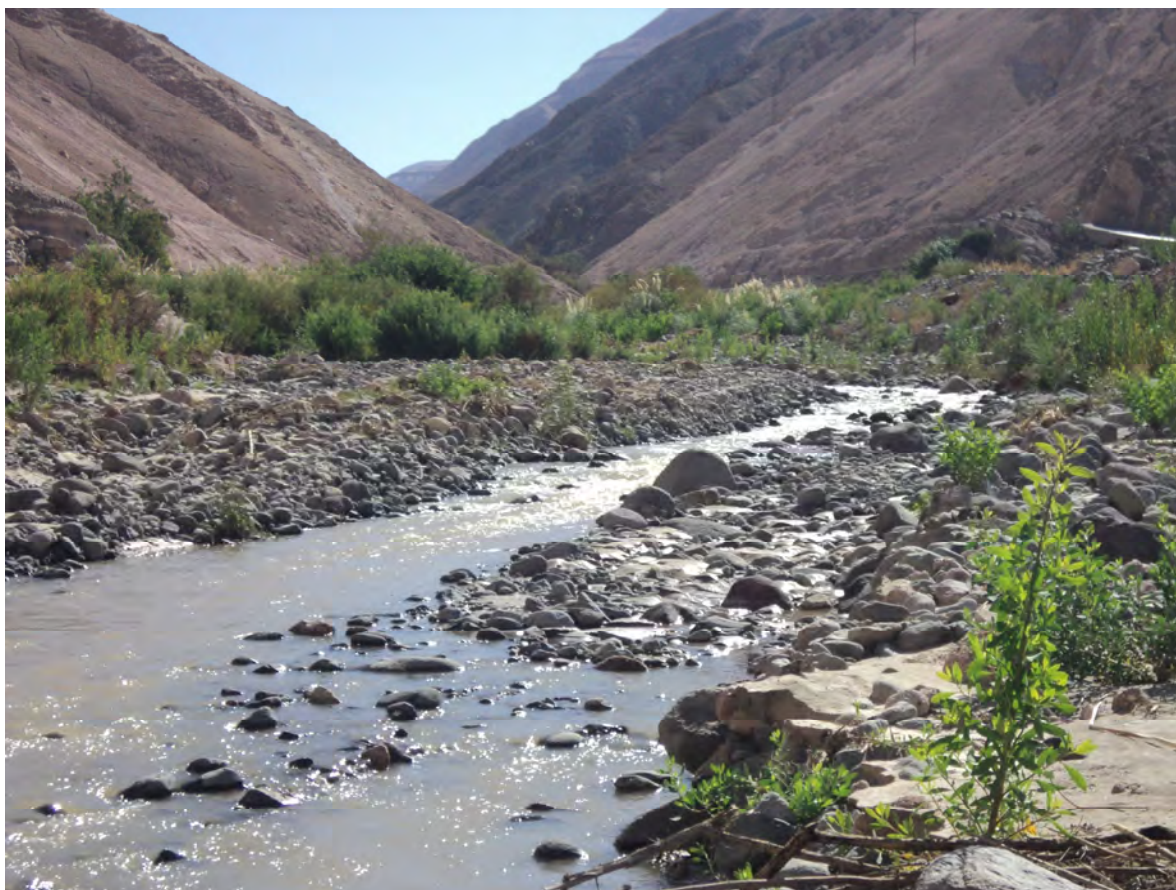
Río de Camiña