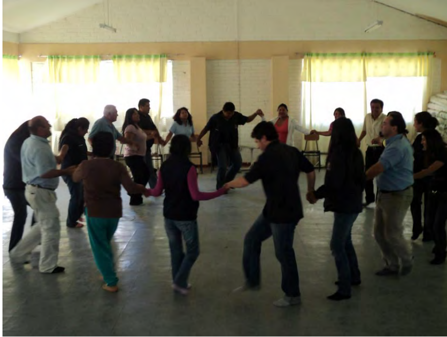
Biodanza con funcionarios municipales