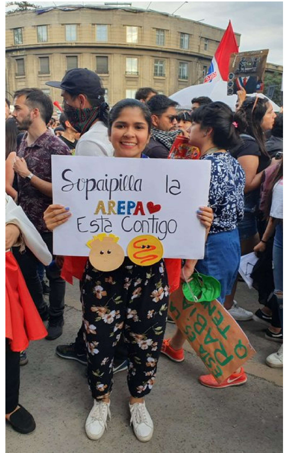
Apoyo de las migrantes a las manifestaciones en Chile, octubre de 2019.

El ser humano, actualmente, está dividido, disociado debido a estas simbolizaciones de tipo cultural. Por ejemplo: una persona que siente mucha culpabilidad, culpa porque le han dado un beso, porque no hizo los deberes de la escuela, porque llegó atrasado a la universidad, porque gana poco, etc. Vive en un mundo de culpa. Entonces, esas culpas se van registrando sobre la musculatura y finalmente la persona tiene un bloque de rigidez dorsal. Otra siente la represión sexual. Piensa que lo sexual es maligno, peligroso, vergonzoso, pecaminoso. Está constantemente proyectando sobre la pelvis esta represión (mecanismo denunciado por Wilhelm Reich). Esto pone tensa la musculatura pélvica de forma crónica y provoca trastornos de la función del orgasmo y rigidez en el acto de caminar. Otro ejemplo es la disociación afectivo-práctica: las personas sienten o desean una cosa y hacen otra. Este trastorno se revela por la disociación entre los brazos y la región pectoral. También ocurre otra forma de disociación a nivel de la cara, por ejemplo: si usted encuentra una