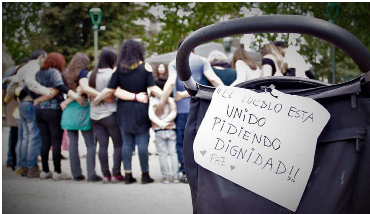
Sesión de Biodanza en la Plaza de armas de Talca, por el derecho de vivir en paz. 27 de octubre de 2019.

No hay transformación político-social a partir de la neurosis. La gente que hace Biodanza pronto siente una necesidad real, una vocación que no es un simple contagio estudiantil, sino una profunda vocación, un llamado para tratar de resolver los problemas humanos en la medida de sus escasas fuerzas. De este modo, se incorporan al magno proceso de transformación. En este momento, quizá parezca muy exagerado hablar de la influencia de Biodanza en la transformación social. Pero nuestros objetivos son absolutamente claros e irrenunciables. Vamos a hacer esta transformación hasta donde podamos.