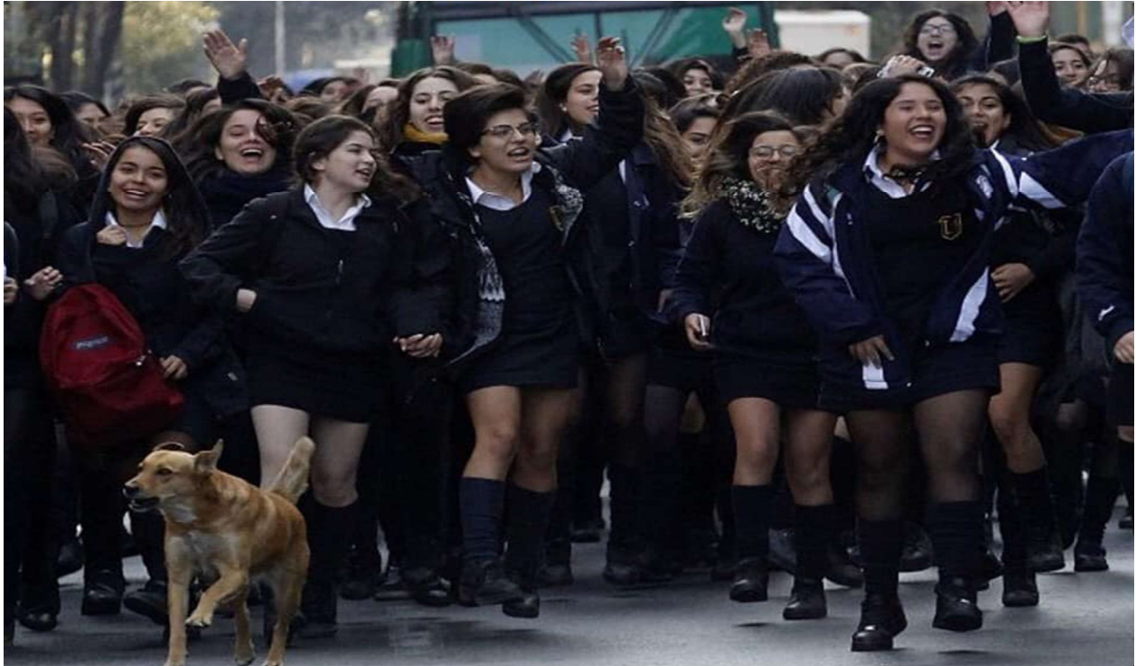
Estudiantes secundarias durante las manifestaciones del Mayo Feminista. Santiago de Chile, mayo de 2019.

humana, es un movimiento vinculado al cosmos. Es algo que nos hermana verdadera y profundamente, no a través de una ideología meramente conceptual, sino que nos hermana con todo lo que somos. Es decir, cada uno de ustedes, aunque no lo sabe, está danzando su vida. Cada uno de ustedes no está en la "Divina Comedia" de Dante Alighieri, ni en la "Comedia Humana" de Balzac. Está en la danza del mundo , de Roger Garaudy.