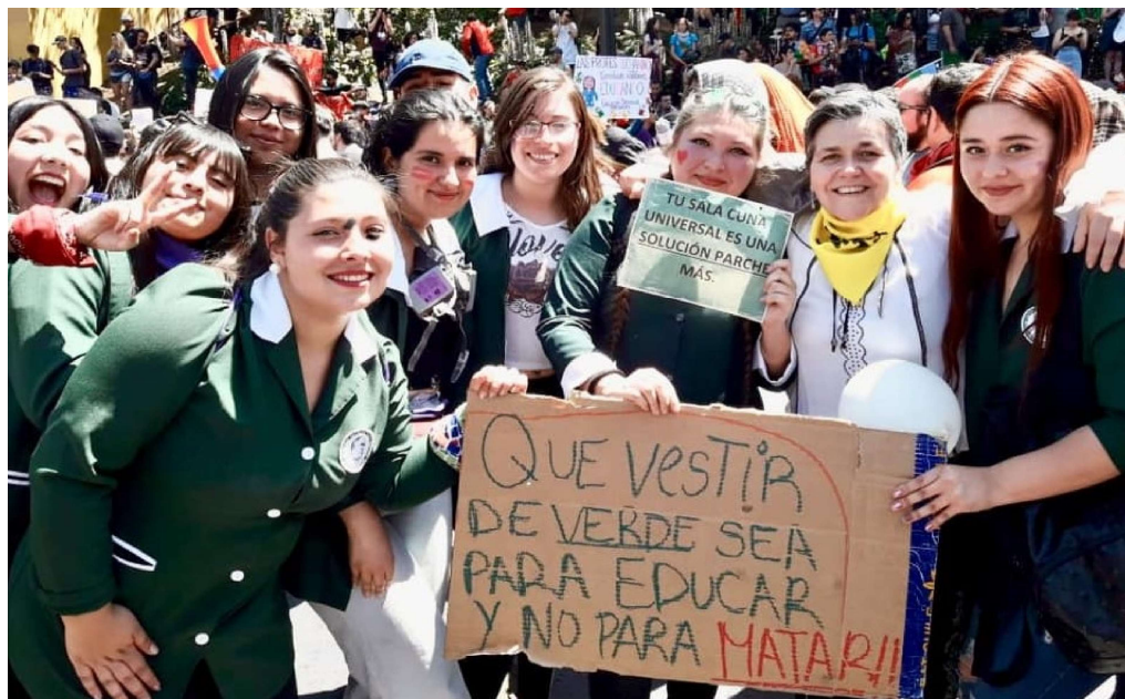
Educadoras de párvulos en las movilizaciones sociales. 29 de octubre de 2019.

RT: Por eso tenemos que transformar también la tecnocracia. Esto, para muchos, puede parecer una utopía: llevar a los tecnócratas un principio de vida. En San Francisco, en California, hice Biodanza con un grupo de físicos nucleares, cibernéticos, ingenieros atómicos, y pronto me di cuenta que también tienen un fondo humano que puede ser rescatado. Si esa gente hace Biodanza, de ella van a nacer las puntas de lanza que van a impedir la expansión de la bomba de neutrones. Nosotros desde nuestra pequeña órbita de influencia, poco podemos hacer. Pero todo el mundo tiene que ser englobado en una transformación. Es importante tener cierta adaptación, cierto nivel mínimo de supervivencia y una capacidad de lucha muy grande. No se puede repetir el proceso de los "hippies", que descubrieron un paraíso, el cual no supieron defender. Ellos supieron